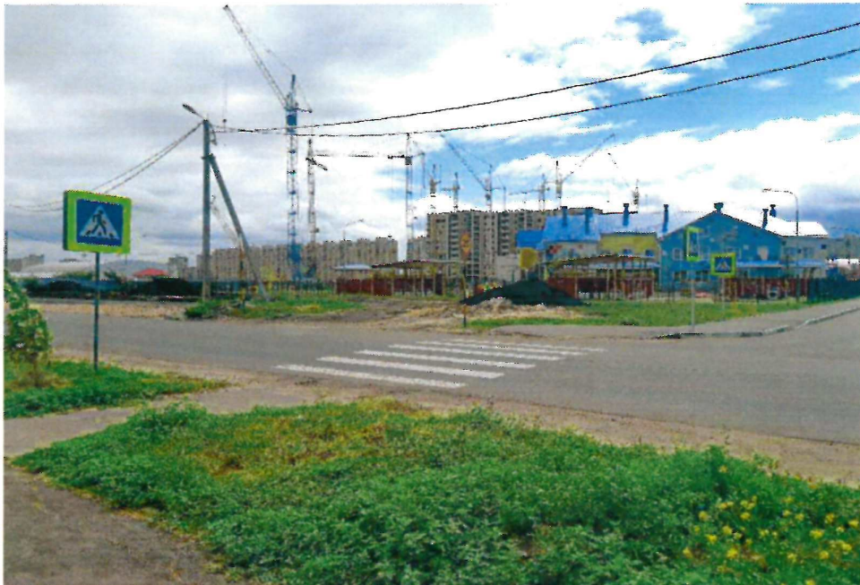
Перекресток ул. Селезнёвской и ул. Бабарыкина