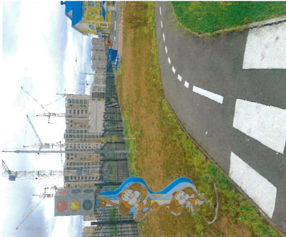
фото на странице: 0