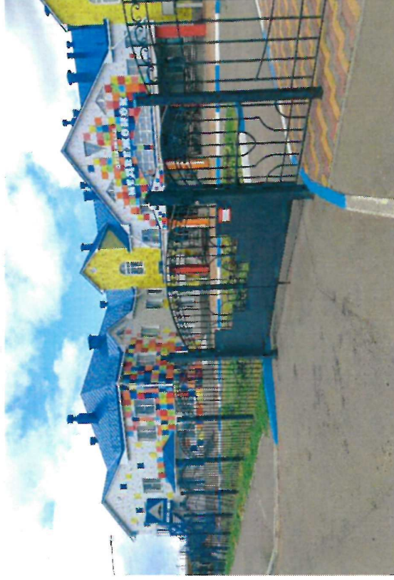
Фото на странице: 0