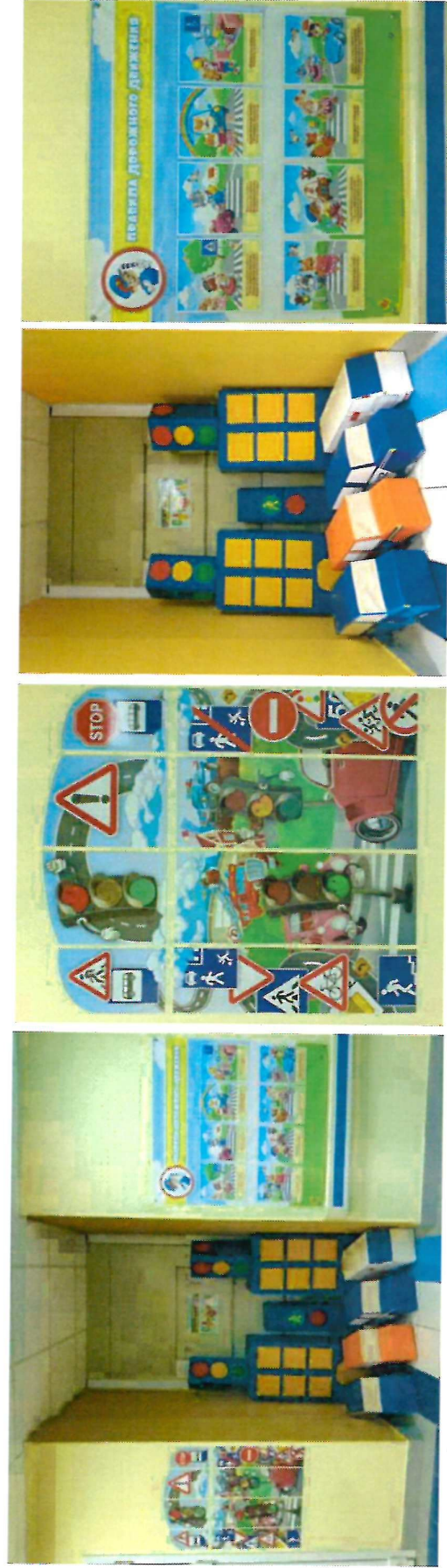
Стенд вход (правая сторона)