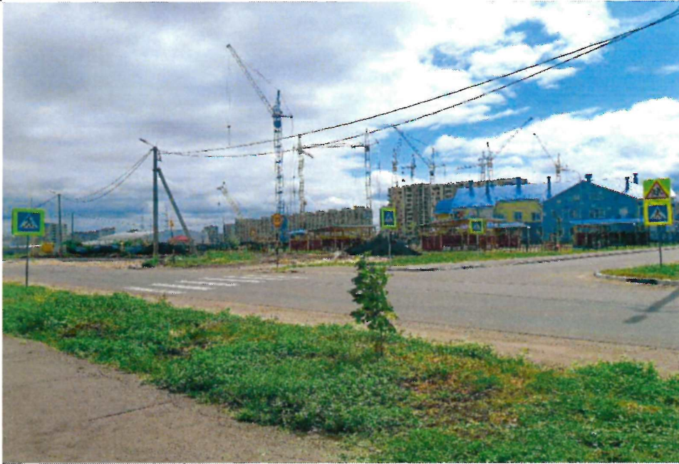
Перекресток ул. Селезнёвской и ул. Бабарыкина